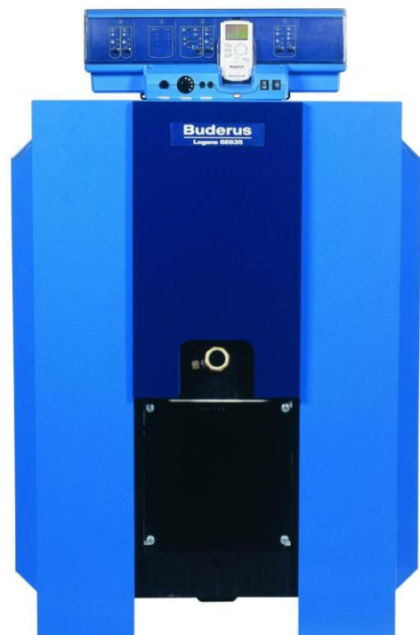
SE635 smidd 3-stråkspanna i olika utförande i området 230-490 kW

Det enkla och säkra montaget säkerställer att systemet blir lönsamt och ger värme under lång tid. Pannorna ger en bekväm, ekonomisk och energibesparande uppvärmning med lågtemperatur teknik och en modern reglerteknik säkerställer olika drifttemperaturer efter behov.