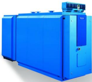
SE735 smidd panna i det högre effektområdet 3-stråk 590-1750 kW

Värmepannor för biologisk olja, biogas, naturgas, gasol och olja med kompletta system för samkörning med värmepump och biobränslepanna.