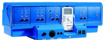
Logamatic 4000 -reglering till singelpanna eller kaskad med en rad praktiska tillbehör